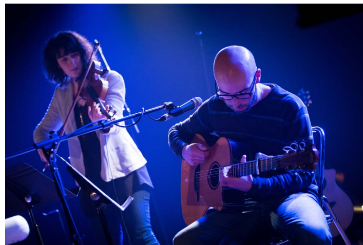
LES PROJETS CULTURELS A NE PAS MANQUER ! Les mots d'hiver 2017

Moment convivial où petits et grands pourront venir partager, échanger autour de différents jeux. Rendez-vous le dimanche 19 Novembre 2017 dans la salle Petruccianni de 14h à 18h.