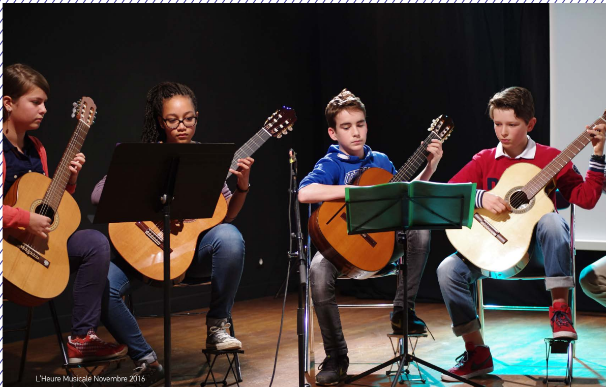
L'Heure Musicale Novembre 2016