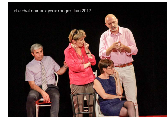
«Le chat noir aux yeux rouges» Juin 2017