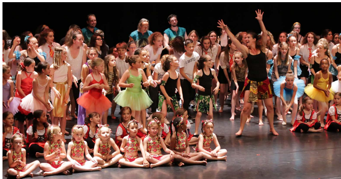
Gala de danse 5 juin 2017