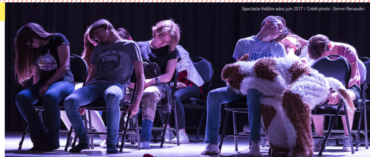
Spéctacle théâtre ados juin 2017 / Crédit photo : Simon Renaudin