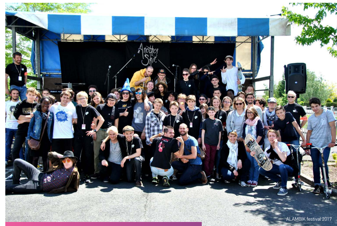
ALAMBIK festival 2017

💡 ASTUCE : penser à faire votre pré-inscription «vacances» par internet avant le début des permanences jeunesse. Programme des vacances disponible au minimum 3 semaines avant !