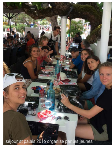
séjour st palais 2016 organisé par les jeunes

💡 ASTUCE : penser à faire votre pré-inscription «vacances» par internet avant le début des permanences jeunesse. Programme des vacances disponible au minimum 3 semaines avant !